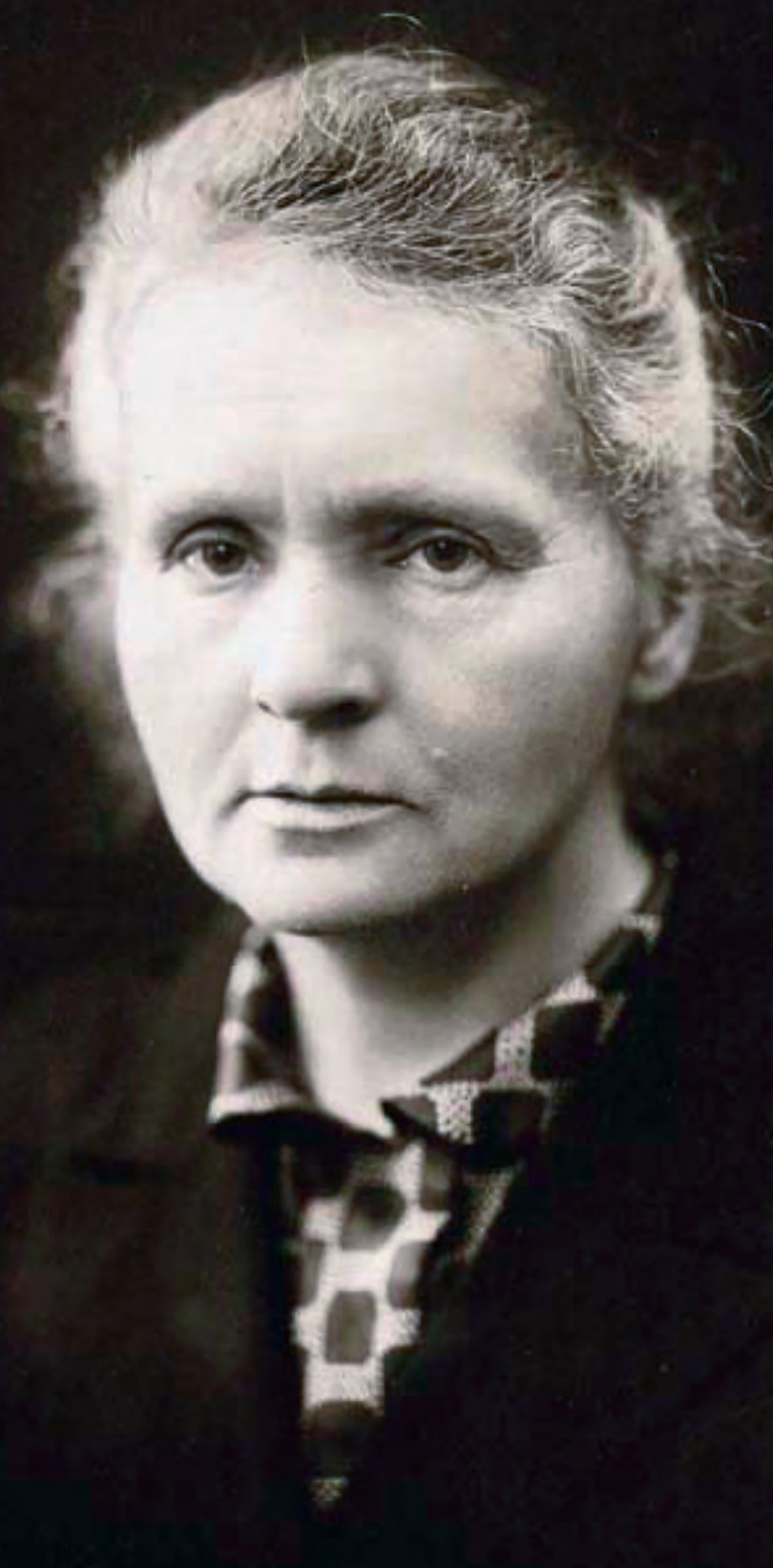
විකිරණශීලීතාව තැවැති ක්ෂේත්‍රයේ පතාක යෝධයෙකු වන මාර් කියුරි මැතිණිය පොලෝනියම් සහ රේඩියම් යන මූලද්‍රව්‍ය සොයා ගනිමින් විද්‍යා ලෝකයේ දිශානතිය දැක්වූ යටි කුරු කිරීමට සමත් වූවාය. එම මූලද්‍රව්‍ය වල ඇති විකිරණශීලීතාවය නිසාම 1934 වර්ෂයේ ජූලි 4 වැනි දින Plastic Anaemia තැවැති රෝගයෙන් පෙළෙමින් ඇය මෙලොව ගැට ගියාය.