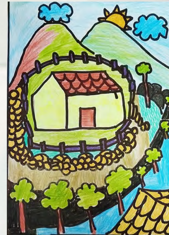
හයිදු මාතේන් මුණසිංහ 6-F