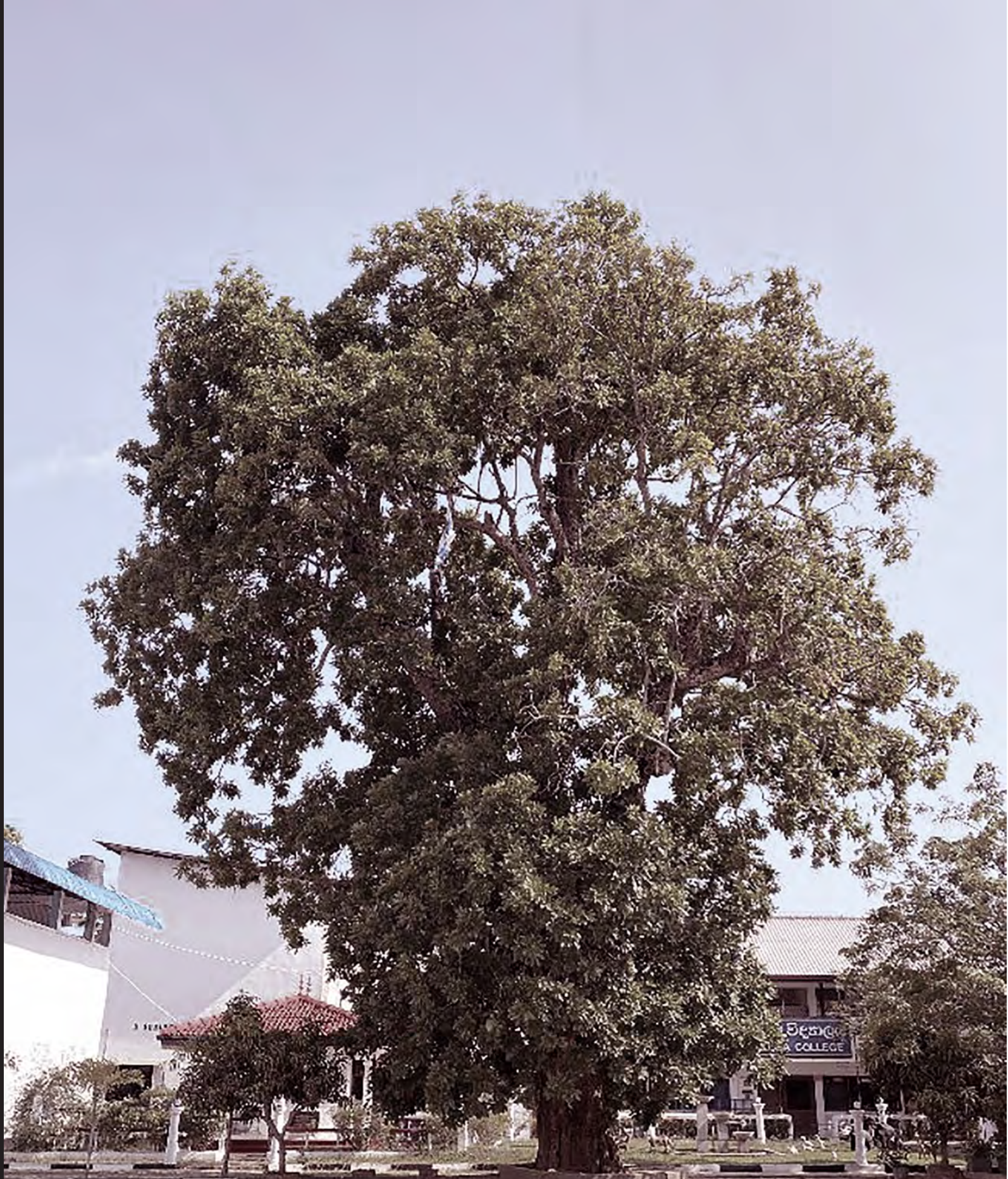
ඒ හින්දම ඒ දවස්වල මම කපේ පුළුවන් තරං ගුවන්ඩි එක වටේට දුවපු එක බැරි වෙලාවත් ටයිම් එක ගාවට ආවත් මම හිටියේ ඇහෝ කලියම නෙත් වෙන තරන් බයකින්. අබේකෝන් යඵ් කාලයක් ගිහින් පෙන්පන් ගියා. එන් නාමන් කොන් ගහ මං දිනා බලන් ඉන්නේ ච්චාගෙන!

මට මේ කොන් ගහ එක්ක බැදීවිච මතකයක් තියනවා. කෝන් ගහ උසයි, බදුන්න හිතන්නවත් බැරි තරම් මහතයි. ඒ කාලේ හැටියට කිව්වොත් අර කවුදෝ දිව්‍යලෝකෙට ගිය ගහ වගෙයි මට මේක පෙනුනේ. අපේ ඉස්කෝලේ හිටිය ලොකු සර්ගේ නමෙත් එක කොටසක් "අබේකෝන්". උඩ රැවුල විතරක් වටපු, හරි අඩුවෙන් හිනා උන අබේකෝන් සරැයි මේ කෝං ගහයි මට පෙනුනෙම එක වගේ, රවාගෙන ඉන්නවා වගෙයි.