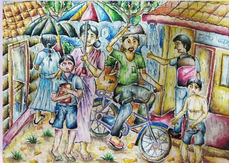
පැහැයුණු හන්දිල් 9-C