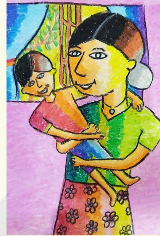
තිවිභූ තුල්සා 6-H