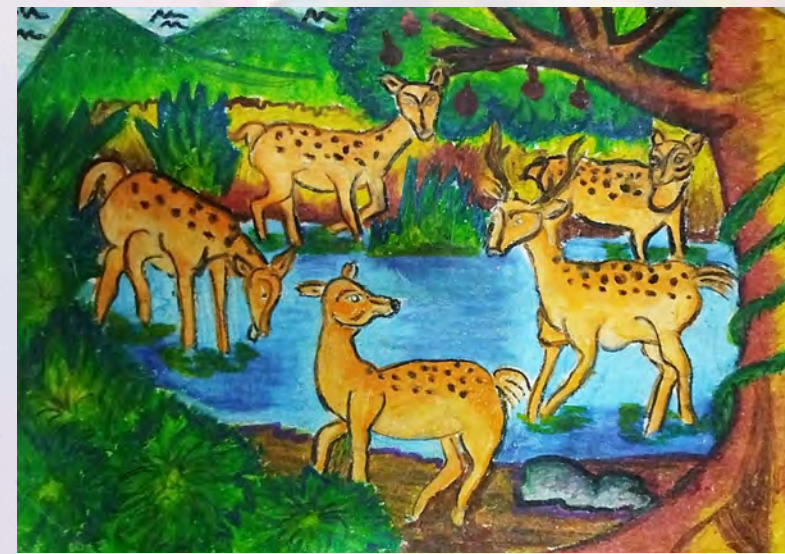
ඉෂාන් ජයතුර 8-C