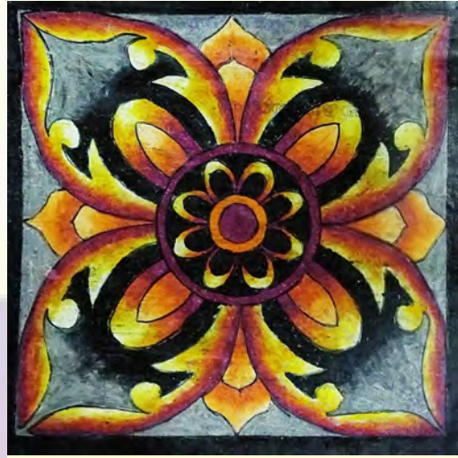
විනුල සංසිත රණතුංග 8-G